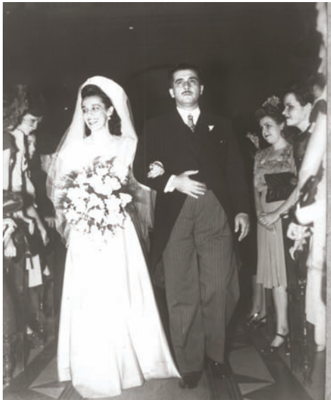
Lezama Lima conduciendo a su hermana Eloísa al altar, en la iglesia de Monserrate, en 1937.